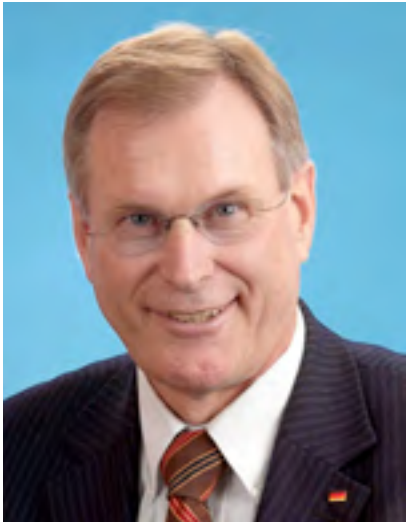
Johannes Singhammer Stellvertretender Vorsitzender der CDU/CSU-Bundestagsfraktion

Wer gesund lebt, hat mehr vom Leben. Besonders in einer alternden Gesellschaft kommt es darauf an, dass Menschen sich frühzeitig vor Krankheiten schützen, um auch im Alter fit zu bleiben. Das Schlüsselwort heißt Prävention. Die CDU/CSU-Bundestagsfraktion setzt sich dafür ein, dass der Gesundheitsvorsorge ein höherer Stellenwert eingeräumt wird. Darüber sprach „Fraktion direkt“ mit dem stellvertretenden Fraktionsvorsitzenden Johannes Singhammer.