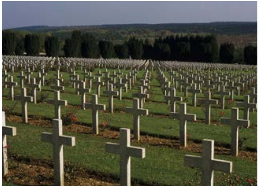
Kriegsgräber auf dem Soldatenfriedhof von Verdun

Der französische Publizist Alfred Grosser, Gastredner in der Gedenkstunde, blickte zurück auf die Epoche