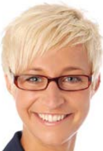
Nadine Schön Stellvertretende Vorsitzende der CDU/CSU-Bundestagsfraktion

Der Schutz von Frauen vor Zwangsprostitution und Menschenhandel ist der CDU/CSU-Bundestagsfraktion ein wichtiges Anliegen. Bereits zu Beginn des Jahres legte sie Eckpunkte für Gesetzesänderungen und Neuregelungen vor. Seitdem laufen die Verhandlungen mit dem Koalitionspartner. Über Ziele und Zeitpläne sprach „Fraktion direkt“ mit der stellvertretenden Fraktionsvorsitzenden Nadine Schön.