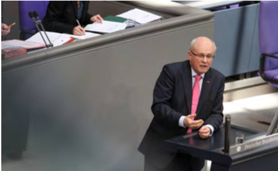
Volker Kauder im Plenum