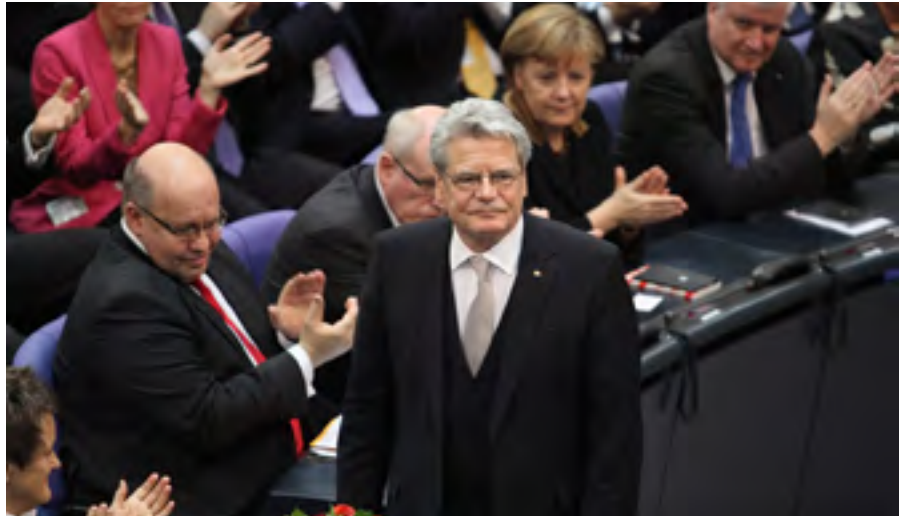
Gauck nach der Wahl