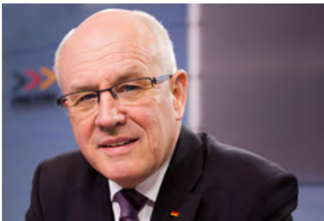
Volker Kauder Vorsitzender der CDU/CSU-Bundestagsfraktion

Zinsen in Europa bewegen sich in die richtige Richtung