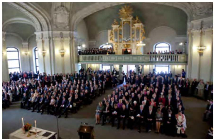
Ökumenischer Gottesdienst vor der Bundesversammlung

Den Amtseid legen die meisten Politiker nach wie vor mit der Invocatio Dei ab: „So wahr mir Gott helfe“. Dies