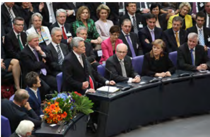
Die Delegierten der 15. Bundesversammlung

Lammert forderte Fairness für Wulff. Hinsichtlich der Rolle der Medien in der Affäre sagte der Bundestagspräsident, manches sei weder