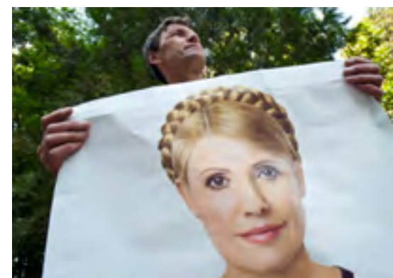
Unterstützung für Timoschenko in Charkiw

raine dürfen nicht ignoriert werden. Mit der damaligen Entscheidung, der Ukraine den Zuschlag für die Austragung der Fußball-EM zu erteilen, wurden gerade die positiven Entwicklungen nach der „orangenen Revolution“ gewürdigt, in der Timoschenko eine führende Rolle gespielt hatte.