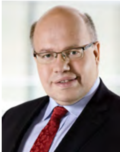
Peter Altmaier Erster Parlamentarischer Geschäftsführer

Weder haben die Piraten das Internet erfunden noch sind sie seine Meister. Sie haben aber mit dazu beigetragen, dass eine breite politische Debatte über Chancen und Risiken des Netzes in Gang gekommen ist. Wir, die Unionsfraktion, sind entschlossen, diese Debatte konstruktiv und offensiv zu führen. Das Internet ist auf dem besten Weg, zu einer zentralen, vielleicht sogar zur wichtigsten Infrastruktur unserer Gesellschaft zu werden. Für Menschen aller sozialen Schichten bietet es – unabhängig von Wohnort, Alter, Einkommen und Status – die Möglichkeit der sozialen und politischen Teilnahme über alle lokalen, regionalen und nationalen Grenzen hinweg. Die rasante technische Entwicklung des Netzes und seine immer stärkere Nutzung verändern die Bedingungen politischer Kommunikation mit hoher Geschwindigkeit. Dies bietet ungeahnte Möglichkeiten, birgt aber auch große Risiken für diejenigen, die sich auf diese Veränderungen nicht rechtzeitig einstellen.