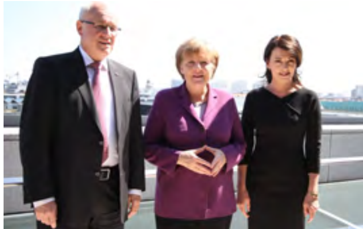
Volker Kauder, Angela Merkel und Iris Berben auf dem Filmempfang

Der kultur- und medienpolitische Sprecher der CDU/CSU-Bundestagsfraktion, Wolfgang Börnsen, sprach sich „mit Nachdruck“ für den Schutz des geistigen Eigentums aus: „Illegales Downloading und Streaming im Internet gefährden die Geschäftsmodelle und Arbeitsplätze der Filmwirtschaft und stellen eine Bedrohung für die kulturelle Vielfalt dar“, sagte er am Rande des Filmempfangs. „Die Union steht an der Seite der Filmschaffenden. Ein wirksames Urheberrecht als rechtliche Grundlage ihrer Arbeit