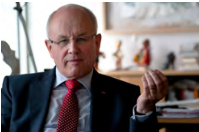
Volker Kauder Vorsitzender der CDU/CSU-Bundestagsfraktion

Kurs der Stabilität darf nicht aufgegeben werden