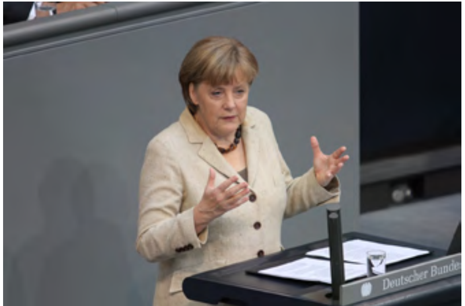
Bundeskanzlerin Angela Merkel während der Regierungserklärung

Zur Ankurbelung des Wachstums riet Merkel der Gruppe der 20, zu der neben den Industrieländern auch die wichtigsten Schwellenländer gehören, Handelshemmnisse abzubauen. Freier Handel und offene Weltmärkte seien die Grundlage für ein tragfähiges