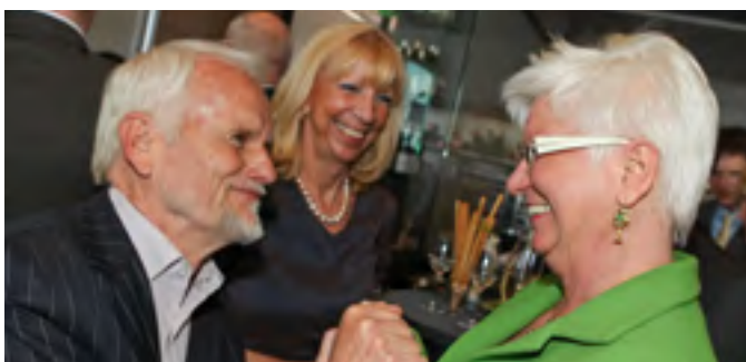
Wolfgang Börnsen und Gerda Hasselfeldt

Namhafte Gäste beim Filmempfang auf dem Dach des Reichstags waren der Regisseur Volker Schlöndorff, die Produzenten Oliver Berben und Hans Geißendörfer sowie die Schauspieler Barbara Schöne, Olli Dittrich und Elmar Wepper.